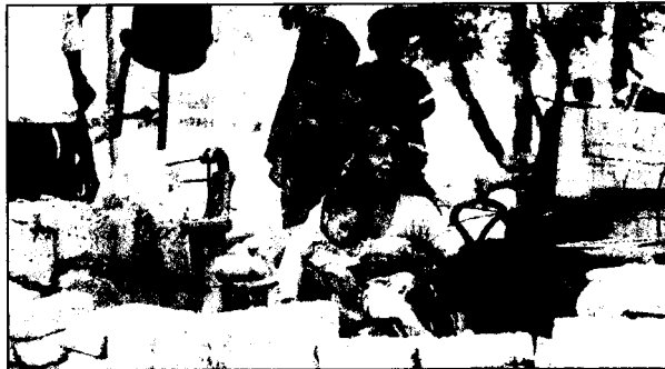
NOTHING SPARED: DDA also demolished a makeshift school

"All that we asked for is a little time to clear our produce. Around 500 huts were also bulldozed. Three generations of farmers have lived here. Akshardham temple, a games village and even the secretariat come under Zone 'O' of Yamuna. But they only bring down our homes," he said, claiming agricultural activities helped recharge groundwater levels and not pollute it.