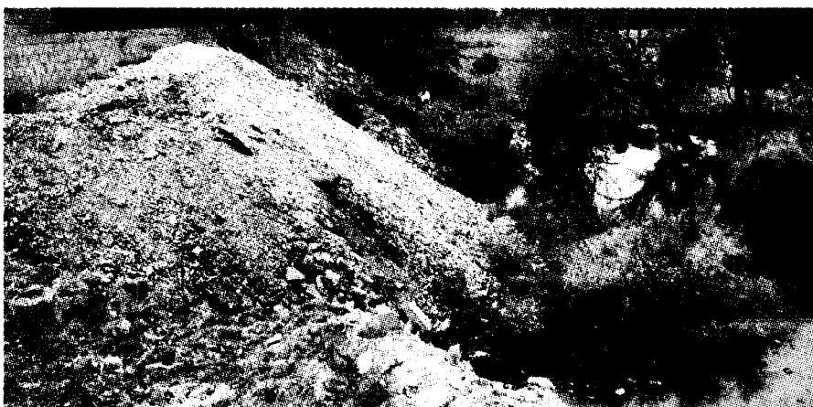
नदी के बहाव क्षेत्र में डाला गया मलबा, जिसका स्थानीय लोग विरोध कर रहे हैं।